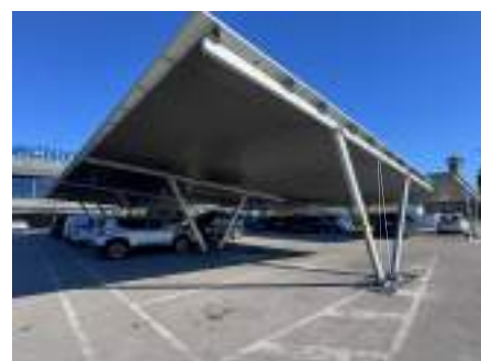
Modèle 3 - São Domingos de Rana, Portugal