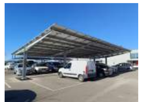
Model 5 - Sabugal, Portugal