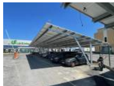
Modèle 2 - Carregado, Portugal