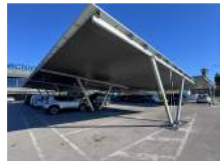
Model 3 - São Domingos de Rana, Portugal