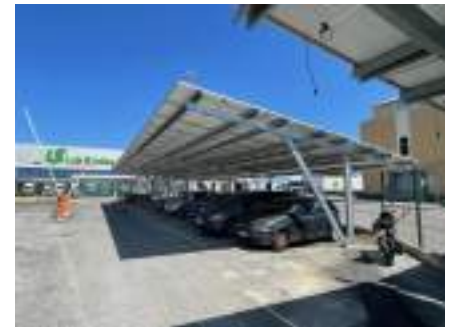
Model 2 - Carregado, Portugal