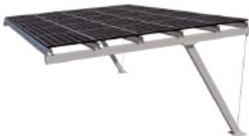
Exemplo - Com Painel Solar