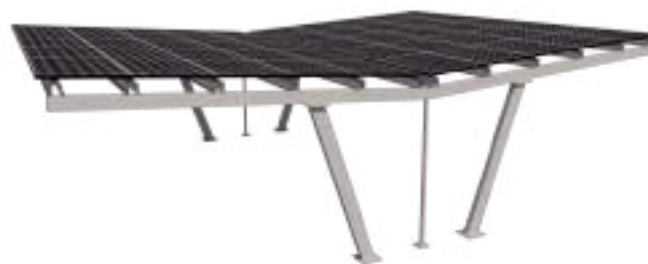
Model 4 - With Solar Panel