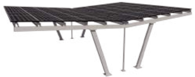
Modelo 4 - Com Painel Solar