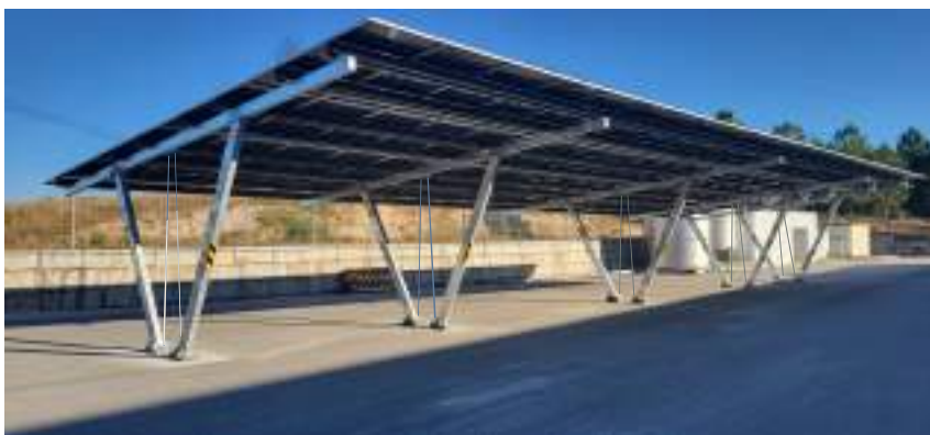
Model 3 - Aguiar da Beira, Portugal