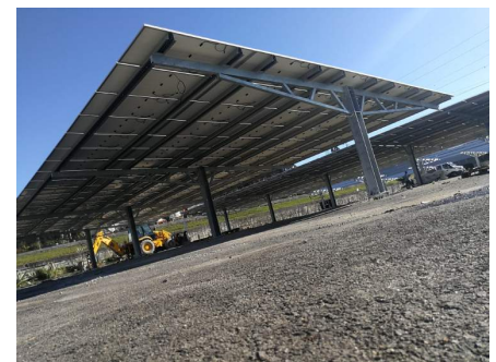
Model 1 - Maia, Portugal