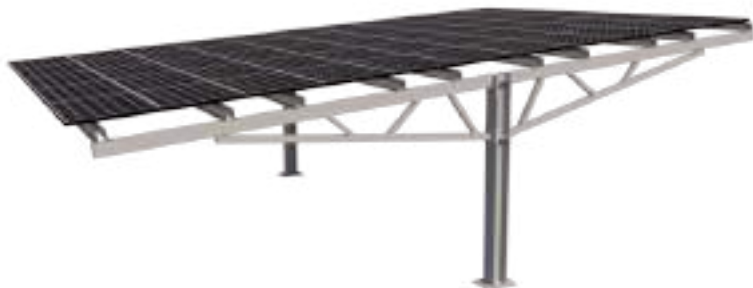
Model 1 - With Solar Panel