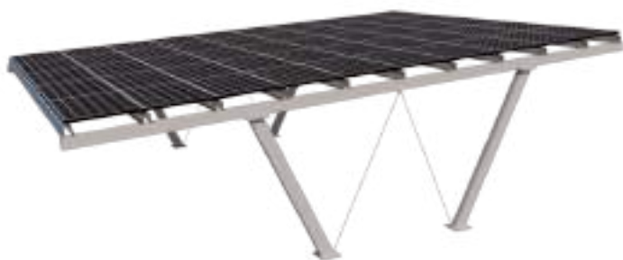
Model 3 - With Solar Panel