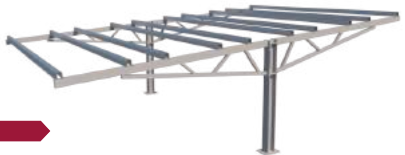
Exemplo - Apenas Estrutura